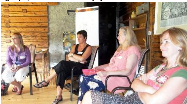
Fotogrāfija: no Tallinas semināra, 06/2011 Photo: from seminar in Tallinn, 06/2011

- Kas palika priekš manis manā "sietā" pēc sadarbības ar Latvijas kolēģiem? Viņu atšķirīgā pieredze un apmācības deva īpašu pieskaņu semināram. Tagad es arī labāk saprotu Trīnas ideju, kādēļ supervīzoram un klientam ir jābūt no līdzīga lauka. Bija patīkami atklāt cirkulāro jautājumu iespējas supervīzijā un es vēlētos iegūt papildus zināšanas šajā jomā.