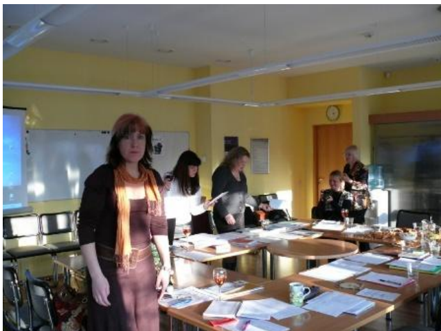
Fotogrāfija: no semināra Rīgā, 11/2010

Kopumā varam secināt, ka vienā no nozīmīgākajiem projekta posmiem, mērķi ir izdevies sasniegt, runājot par ķēdes klients – profesionālis – supervīzors – profesionālis – klients principu.