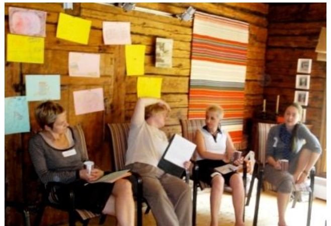
Fotogrāfija: no Tallinas semināra, 06/2011